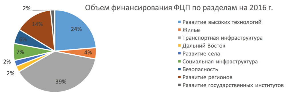
Рис. 2. Объем финансирования ФЦП по разделам на 2016 г.