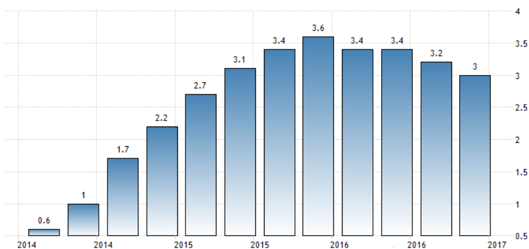
Рис. 2. Темпы роста ВВП Испании