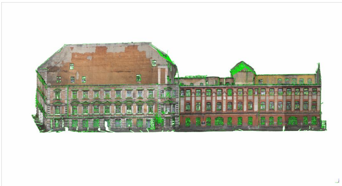
Рис. 1. Полигональный вид Янтарной мануфактуры