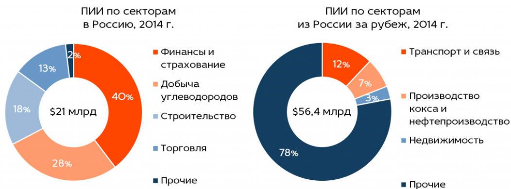
Рис. 1. ПИИ по секторам в Россию и из России за рубеж, 2014 г.